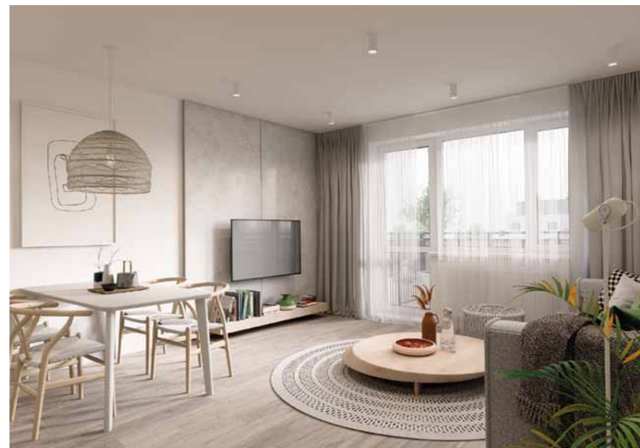
V nabídce převažují byty s dispozicí 2+kk. Skvěle se tak hodí zejména pro páry.