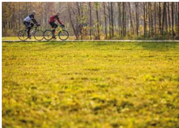
Projekt Albatros Kbely leží přímo na cyklostezce, je tak ideálním výchozím bodem pro Vaše víkendové vyjížd'ky.