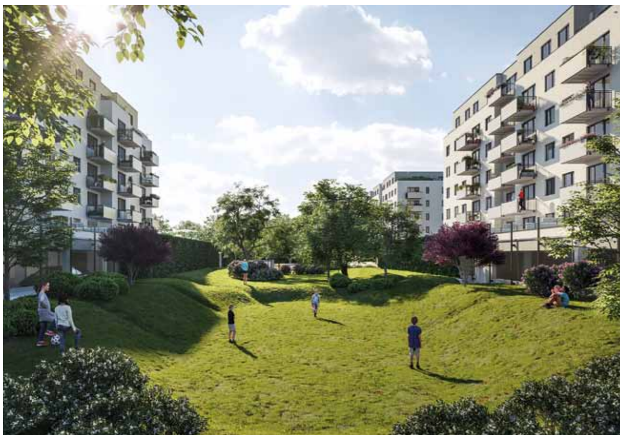
V prostoru mezi domy pracujeme s terénními průlehy a poldry, které pomáhají zadržovat dešťovou vodu v lokalitě.