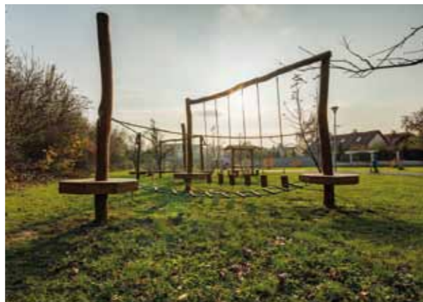
V kbelských parcích najdete hřiště i cvičební pomůcky pro všechny věkové kategorie.