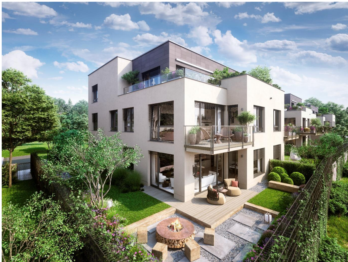
Vizualizace exteriéru projektu Čertův vršek