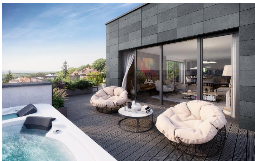
Na terase posledního patra si klient může nechat nainstalovat například privátní vířivku