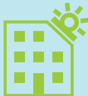
Nízkoenergetický bytový dům